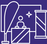
Messut ja tapahtumat