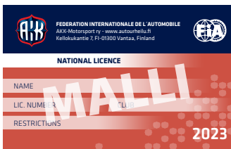
Nationaliisäkortti kansallisen lisenssin haltijalle.