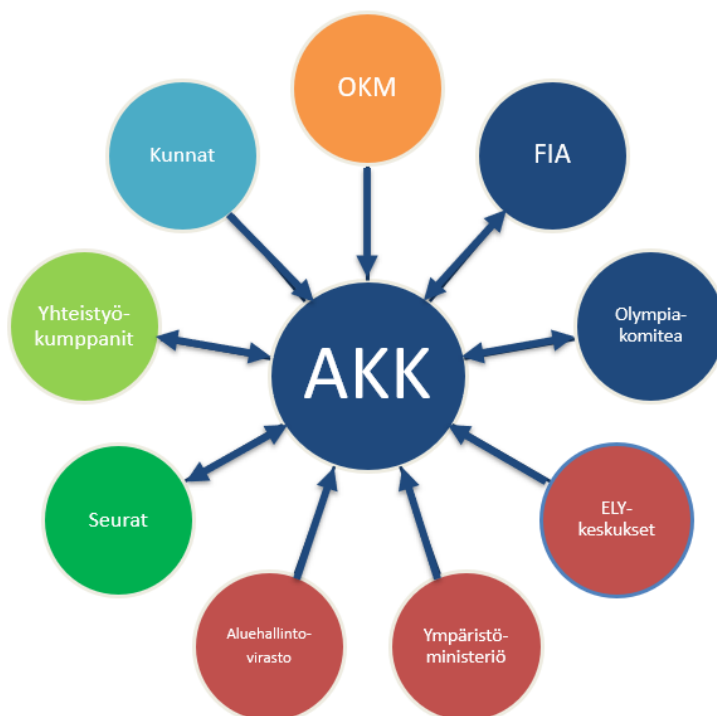
KUVIO 2: AKK:n ympäristöasioiden keskeiset sidosryhmät ja toimijat.

AKK-Motorsport tekee monitahoista yhteistyötä ympäristövastuutyössä useiden eri toimijoiden kanssa.